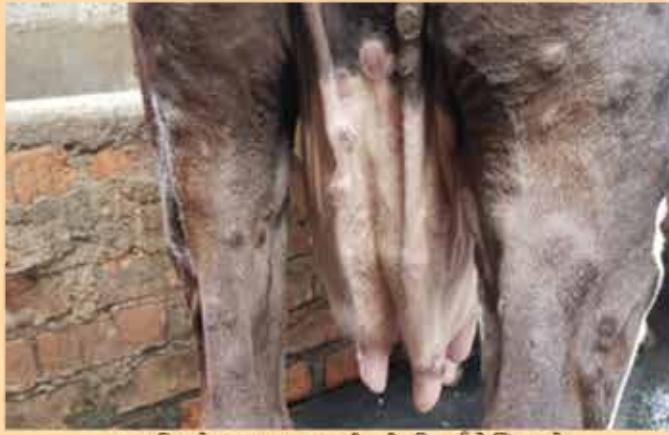
पछाडिको भाग र थुन वरिपरि गिर्खा देखिएको